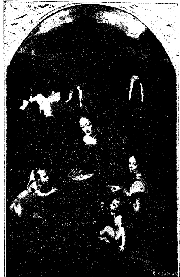
Η ΠΑΡΘΕΝΟΣ ΤΩΝ ΒΡΑΧΩΝ