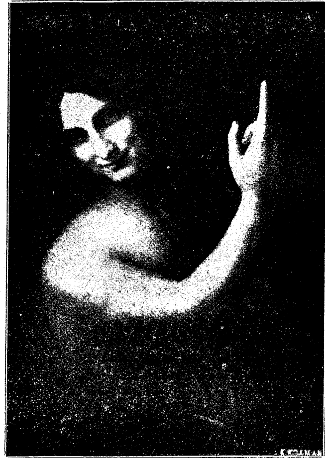
Ο ΑΓΙΟΣ ΙΩΑΝΝΗΣ Ο ΒΑΠΤΙΣΤΗΣ

Πολὺ ὀλίγα πράγματα γνωρίζομεν περὶ τῆς νεανικῆς