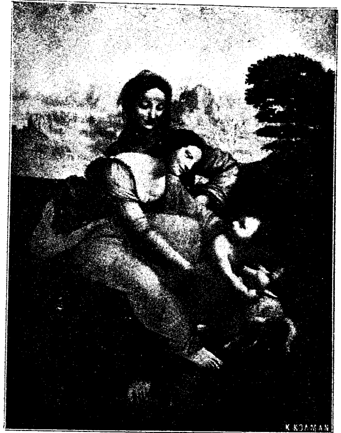
Ἡ ΠΑΝΑΓΙΑ, Ἡ ΑΓΙΑ ANNA ΚΑΙ Ο ΙΗΣΟΥΣ

Ὁ ἀνδρικός χαρακτὴρ τοῦ Λεονάρδου, παρουσίαζε καὶ ἄλλας ἀκόμη ιδιομορφίας καὶ καταφανεῖς ἀντιφάσεις. Θὰ ἠδύνατό τις νὰ διακρίνῃ εἰς αὐτὸν ἀρκετὴν δόσιν νωθρό- τητος καὶ ἀδιαφορίας, εἰς μίαν ἐποχὴν κατὰ τὴν ὁποίαν ἕκαστος ἐπεζῆτει τὴν κατάκτησιν εὐρυτέρου πεδίου ἐνερ- γείας, πρᾶγμα τὸ ὁποῖον ἀπαιτεῖ καταβολὴν ἐξαιρετικῆς ἐνεργητικότητος. Ὁ Λεονάρδος ἐχαρακτηρίζετο διὰ τὴν προό- τητα καὶ τὴν ἀποχὴν ἀπὸ κάθε κομματισμὸν καὶ ἰδιόνοϊαν. Ἦτο γλυκὺς καὶ ἀξιαγάπητος πρὸς ὄλους, δὲν ἦτο, λέγουν, σαρκοφάγος, εὐρίσκων κακὸν τὴν ἀφαίρεσιν τῆς ζωῆς τῶν ζώων, ἠὺχαριστεῖτο δὲ τὰ μέγιστα ν' ἀγοράζῃ τὰ πωλού- μενα μικρὰ πτηνὰ καὶ νὰ τοὺς ἀποδίδῃ τὴν ἐλευθερίαν, κατεδίκαζε τὸν πόλεμον καὶ τὰς αἰματοχυσίας, ὠνόμαζε τὸν ἀνθρώπον βασιλέα τοῦ ζωϊκοῦ βασιλείου καὶ κατώτερον τῶν ἀγρίων ζώων. Ἡ σχεδὸν θηλυπρεπὴς αὐτῆ εὐασθησία δὲν τὸν ἠμπόδιζε ὅμως ἀπὸ τοῦ νὰ παρακολουθῇ τοὺς κατα-