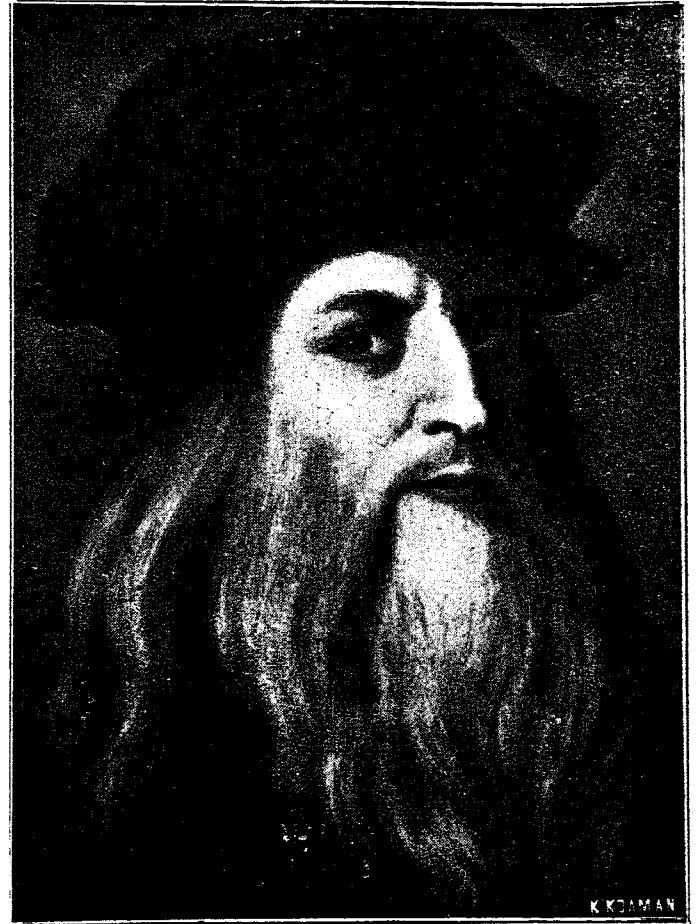
ΛΕΟΝΑΡΔΟΣ ΝΤΑ ΒΙΝΤΣΙ (ΑΥΤΟΠΡΟΣΩΠΟΓΡΑΦΙΑ)